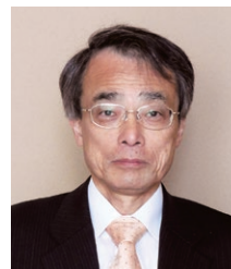
NPO HACCP 実践研究会 幹事・主幹研究員 子林技術士事務所 代表